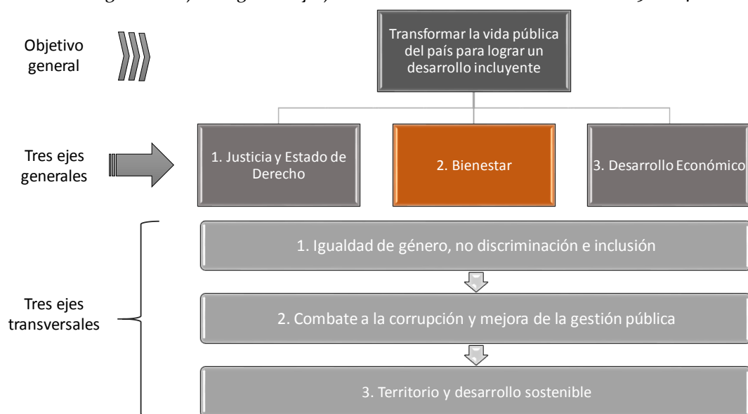
Figura 1. Objetivo general y ejes del Plan Nacional de Desarrollo 2019-2024

Fuente: Elaboración propia con información de documento relativo al Plan Nacional de Desarrollo 2019-2024, Anexo, publicado en la Gaceta Parlamentaria de la Cámara de Diputados.