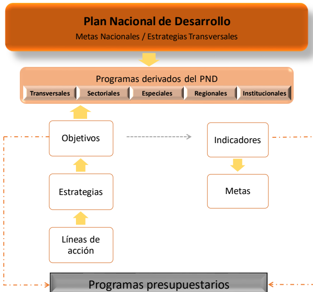
Figura 2. Vinculación de los programas presupuestarios al Plan Nacional de Desarrollo