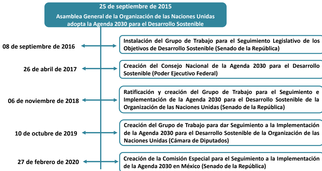
Figura 1. Mecanismos del Poder Legislativo y Ejecutivo para el cumplimiento de la Agenda 2030

La adopción de la Agenda 2030 para el Desarrollo Sostenible supone, para los países firmantes, la creación de diversos mecanismos para alinear el diseño de sus políticas con los Objetivos de Desarrollo Sostenible, así como la implementación de instrumentos para el seguimiento de su progreso en la consecución de estos objetivos. El presente texto se enfoca en describir algunos de los principales mecanismos con los que cuenta el Poder Ejecutivo y Legislativo en México para dar seguimiento a la Agenda 2030. Dentro de estos destacan la Comisión Especial para el Seguimiento a la Implementación de la Agenda 2030 en México en el Senado de la República, así como el Grupo de Trabajo para dar Seguimiento a la Implementación de la Agenda 2030 para el Desarrollo Sostenible, albergado en la Cámara de Diputados 1 .