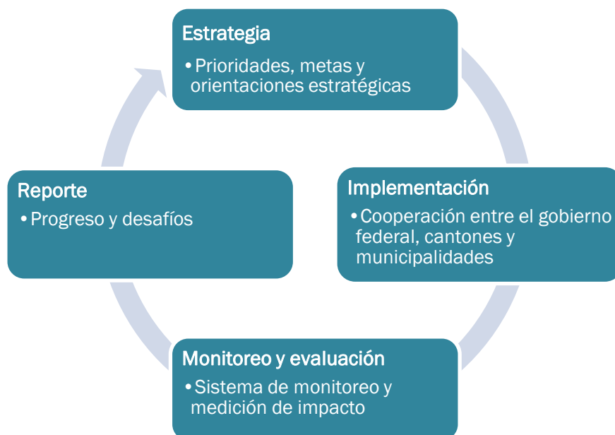
Figura 2. Responsabilidades en el ciclo de política pública en la implementación de la Agenda 2030

El caso suizo provee un objeto de estudio interesante pues su implementación de la Agenda 2030 está basado en un ciclo de políticas públicas de cuatro años (figura 2)