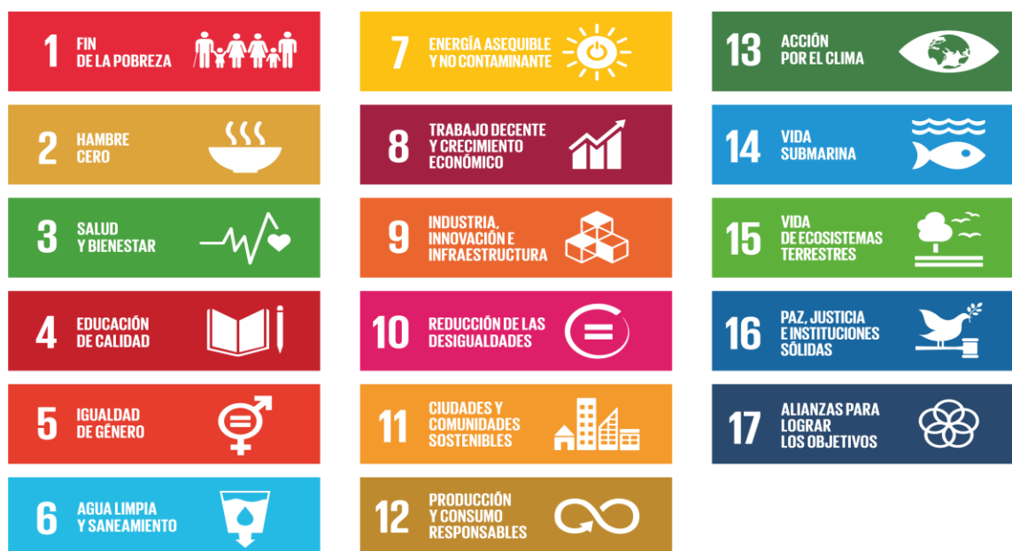
Imagen 1. Objetivos de Desarrollo Sostenible

En la tabla 1, se presentan otros ejemplos de las lecciones aprendidas de los ODM retomadas en los ODS.