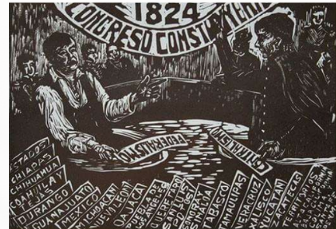
La Constitución de 1824, Elena Huerta, Offset, ca. 1950.