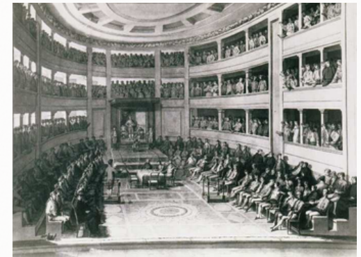
Salón de Cortes, Juan Gálvez, 1812.