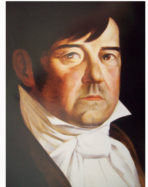
Dr. Miguel Ramos de Arizpe. Museo Nacional de las Intervenciones