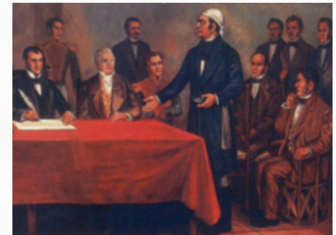
Congreso de Chilpancingo el día de la redacción del Acta Solemne de la Declaración de Independencia de la América Septentrional