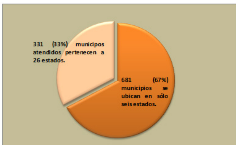
Gráfica 3. Distribución de los municipios atendidos por la Cruzada Nacional contra el Hambre, 2015