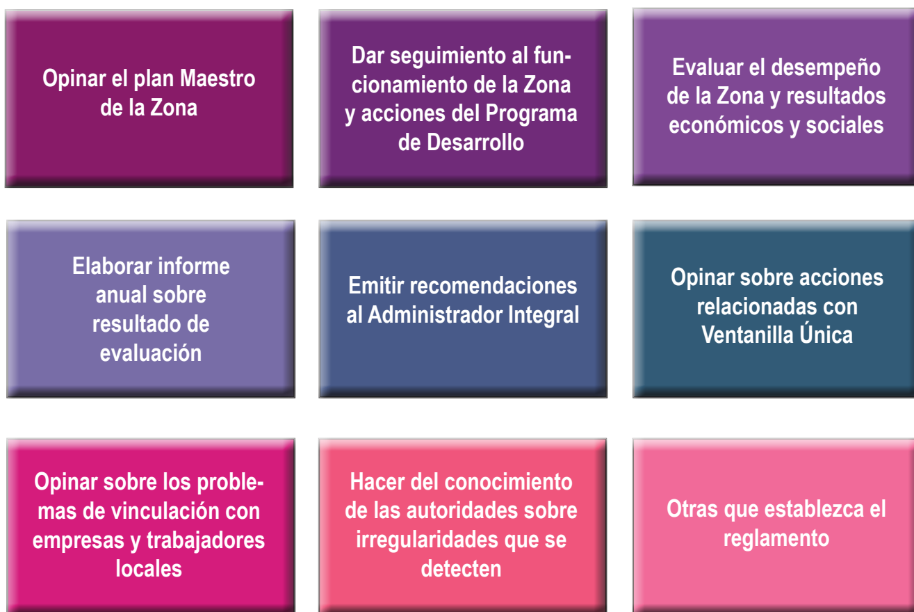
Gráfico 2. Funciones del Consejo Técnico