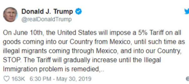
Fig. 1 Twitter de Donald Trump en el que establece la posibilidad de imponer aranceles a México

En este escenario y en el preámbulo de su campaña electoral para reelegirse como presidente de los Estados Unidos, el 29 de mayo de 2019 Donald Trump planteó que si México no detenía la migración indocumentada que ingresa a los Estados Unidos, aplicaría aranceles de 5% a las importaciones mexicanas a partir del 10 de junio del mismo año, los cuales se incrementarían gradualmente en caso de que continuase el problema hasta llegar a un 25%.