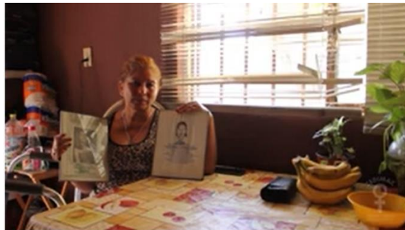
Ecos del Desierto - Campo de Algodón 2001

Te sugerimos ver el contenido de los siguientes videos sobre estas resoluciones: