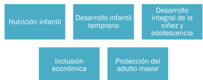
Figura 4. Ejes temáticos de política social