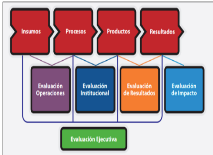
Figura 2. Tipos de evaluación previstos por SINERGIA

política de evaluación del gobierno colombiano. Un elemento interesante de este caso es que se contempla la realización tanto de evaluaciones internas como externas, así como que la planeación de las evaluaciones está guiada por la lógica de la política pública vista como un proceso (fig. 2).