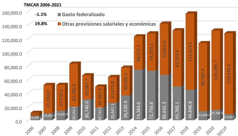
Gráfica 2. Evolución de los recursos asignados al Ramo 23 Provisiones Salariales y Económicas por concepto, 2006-2021 (Millones de pesos corrientes)

Por tanto, de aprobarse el presupuesto en los términos planteados en el PPEF-2021, el gasto federalizado del Ramo 23 perdería participación en el total y observaría una tasa media de crecimiento anual real (TMCAR) negativa de 1.1% para el periodo 2006-2021; mientras que los Otros conceptos de Provisiones Salariales y Económicas tendrían una TMCAR de 19.8% (ver Gráfica 2).